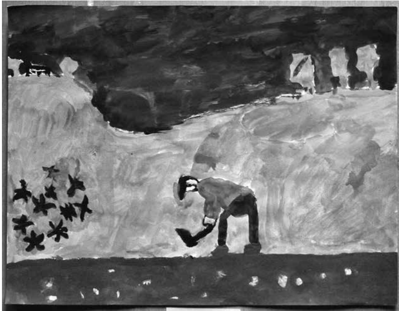
BORIS BRAJKOVIĆ,4.r RAD U POLJU Mentor:Matilda Vidović OŠ Gripe,Split