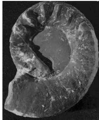
Amonit Tiroilites cassianus (QUENSTEDT) iz naslaga gornjeg skita u Muću. Čest je amonit u naslagama gornjeg skita.