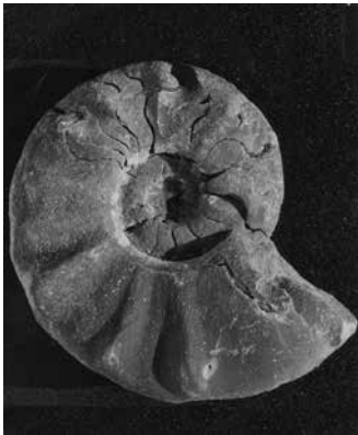
Amonit Dinarites tirolitoides KITTL iz naslaga gornjeg skita u Muću. Dosad je nađen samo u naslagama gornjeg skita u Muću.